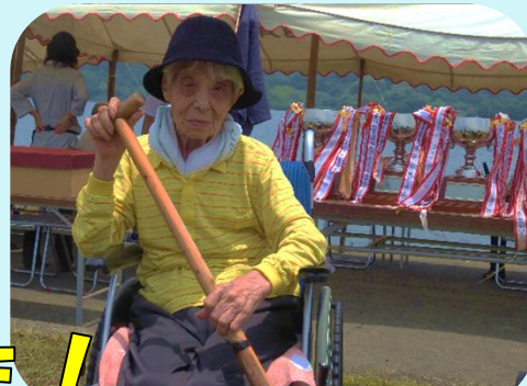
晴天に恵まれました!

当日は天候にも恵まれ、琴海地区ペーロン大会の応援へ行きました。参加した利用者様は、目の前に往来するペーロンを目で追い、自然と「頑張れ!!」と応援する姿がありました。「外で見るのは、気持ちの良かね～」という声も多く見られ、海風を感じながら、ペーロンの漕ぎ手の勇ましさに感動した日となりました。