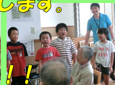
童謡「うみ」の大合唱!!

形上小学校4年生の生徒さん11名と琴の浦荘との福祉交流が今年もスタートしました。前半は施設見学を行い、施設内の工夫を学び熱心にメモをとっていました。後半は、デイサービスの利用者との交流会を行いました。手作りの名刺を渡し、元気よくあいさつすると利用者様も大変喜ばれ、名刺を何度も読み返していました。クイズやゲーム、童謡「うみ」を合唱し有意義な時間を過ごすことができました。