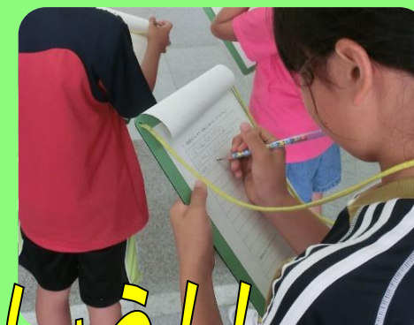
施設内の工夫を見つけてみましょう!!