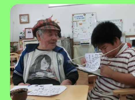
はじめまして! よろしくお願いします。