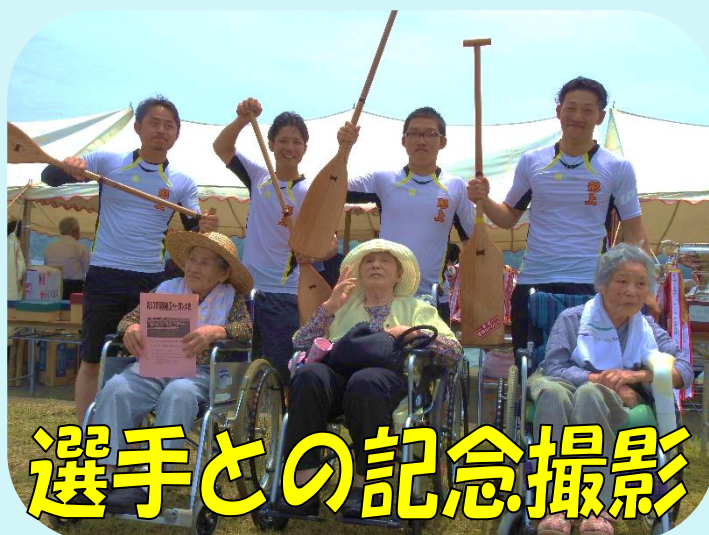
選手との記念撮影