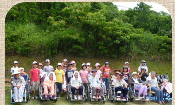
みんなで記念撮影今年もまた一つ楽しい思い出が増えました!!!

はりきっていも植えをする子どもたち。入居者の皆さまも子どもたちに「こんがんとよ!」と積極的に声をかけていらっしやいました。元気いっぱいの子供たちの姿とそれを目を細めて温かく見守る入居者様の姿。私たちも楽しい交流会となり、とてもうれしく思います。 苗がどんどん育ち、秋には大きなお芋ができることを楽しみに見守り、収穫のときには皆さんと収穫祭ができたと思っています。