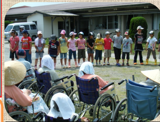
小学生の皆さんによる歌のプレゼント