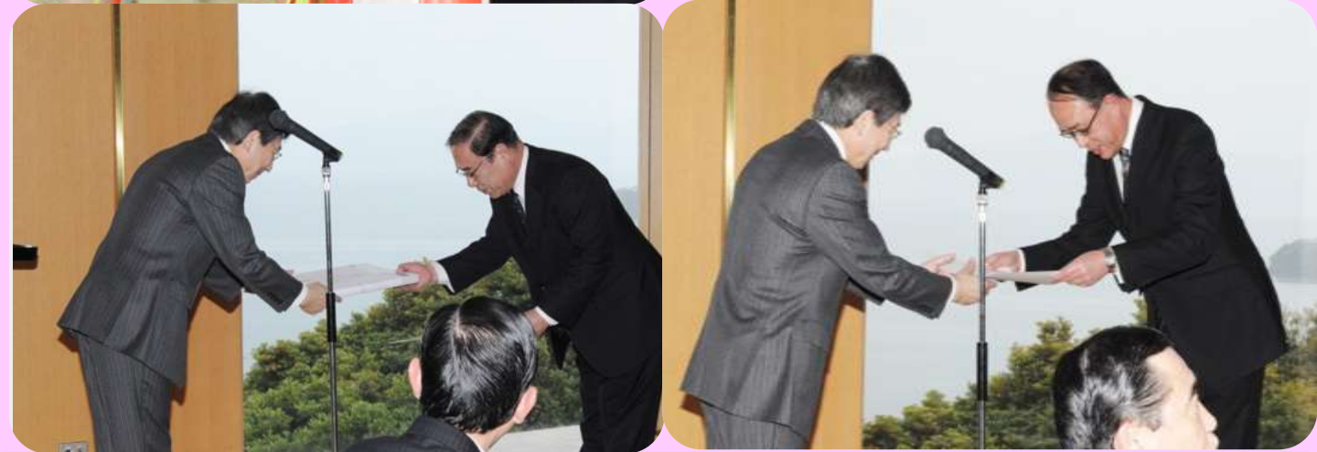
3月17日、琴の浦荘の落成式・祝賀会をとり行いました。 田上市長をはじめとした来賓の皆様方や工事関係者、法人関係者など多数の方々にお越しいただきました。地域交流ホールにて大浦諏訪神社の厳粛な神事をとり行ったあと、パサージュ琴海に移動し、祝賀会を行いました。