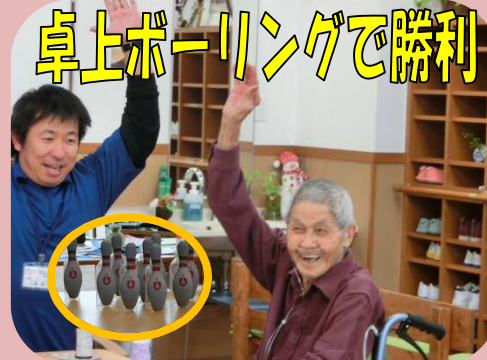
卓上ポリングで勝利